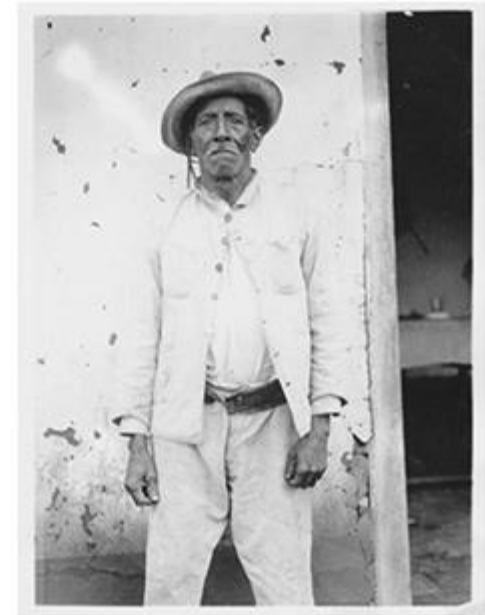
3 The Bakairi Antonio. Photographer: Max Schmidt. 1927 © Ethnologisches Museum – SMB (VIII E 4861).

Investigar quiénes son los sujetos involucrados en las reapropiaciones, implica además identificar qué tipo de relaciones se generan entre los actores clave en el trabajo de reapropiación e interpretación, qué relación tienen con los representados, quiénes pueden acceder y quienes no a las imágenes y bajo qué circunstancias. Fotografía en América Latina destaca por su interés en visibilizar el rol de la fotografía como un arena de discusión en torno a qué apropiaciones son legitimadas por los nuevos usuarios y cuáles no. Es decir, ¿Hay reapropiaciones mejores o más válidas que otras de qué depende? Aquí, el término “brecha visual” entendido como la inequidad existente en la fotografía como representación, materialidad y práctica social, acuñado por Kummels, es una contribución con intenciones de quedarse en próximas investigaciones desde la antropología visual.