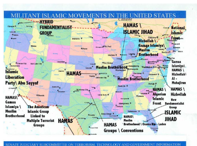
Figura 2. Movimientos militantes islámicos en Estados Unidos

A su vez, siguiendo esa teoría el gobierno recuperó informes (Figura 2) realizados años antes de los atentados donde se demostraba que las células terroristas habían logrado establecerse en EEUU y actuaban de manera independiente.