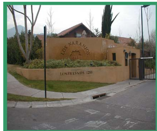
ENTRADA CONDOMINIO "LOS NARANJOS"

La siguiente etnografía se realizó en el sector de la Avenida Pedro Fontova de la comuna de Huechuraba [2] (ex Fundo "El Carmen") también conocido como "Valle de Huechuraba", en el cual en los últimos años han proliferado los condominios y urbanizaciones privadas como expresión del acelerado crecimiento de la ciudad de Santiago. Específicamente se trabajó en el condominio "Los Naranjos", el cual pertenece al conjunto residencial "El Carmen de Huechuraba" y en la calle "Liencura" que funciona como un microbarrio al interior la