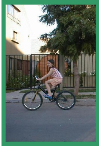
AVENIDA CACIQUE CHILENO "SANTA ROSA DE HUECHURABA"