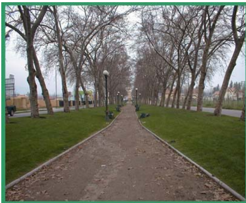
PARQUE UBICADO EN AVENIDA PEDRO FONTOVA, MANTENIDO POR LA INMOBILIARIA QUE CONSTRUYO LOS CONDOMINIOS “EL CARMEN DE HUECHURABA”.

contexto urbano actual. Como ya señalamos, al inicio hemos considerado distintos soportes para dar cuenta de una realidad diversa poblada de discursos que resignifican una nueva forma de habitar el espacio recreando un imaginario opuesto a la idea de “urbe” moderna, donde recobra sentido una vida vinculada a un pasado rural y comunitario. Sin embargo en cierta medida estamos frente a una paradoja de la modernidad ya que al parecer el único mecanismo para lograr este estilo de vida es a través del acceso al mercado el que lo posibilita y controla. Recordemos que detrás de estos conceptos de una idealización de la vida desconectada de la ciudad y antimoderna hay todo un circuito de empresas operando detrás de este imaginario.