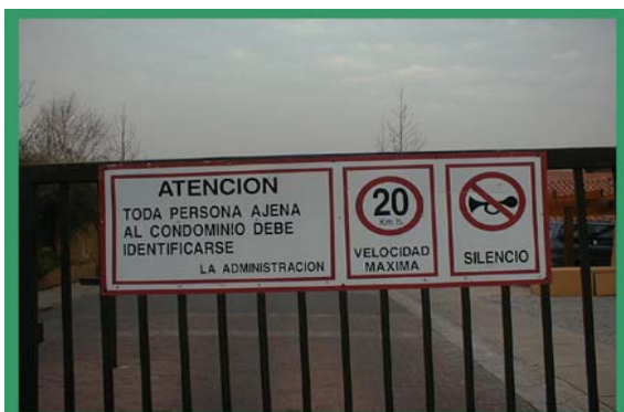
REJA DE ACCESO CONDOMINIO "LOS NARANJOS"

zonas periféricas de la ciudad, donde hay todo un sistema que resguarda y posibilita este estilo de vida, que podemos definir como de “libertad tutelada”, en tanto que estos espacios están protegidos por guardias, rejas e incluso un cerco eléctrico ubicado en el cerro que rodea el lugar. De alguna, manera podríamos decir que la forma que estas personas conciben una vida más tranquila, segura y paradójicamente libre, es a través del respaldo de empresas que administran esta seguridad. Por otra parte, es importante considerar que el objetivo principal está relacionado con resguardar y proteger el entorno en el cual se desenvuelven los niños fuera de la casa.