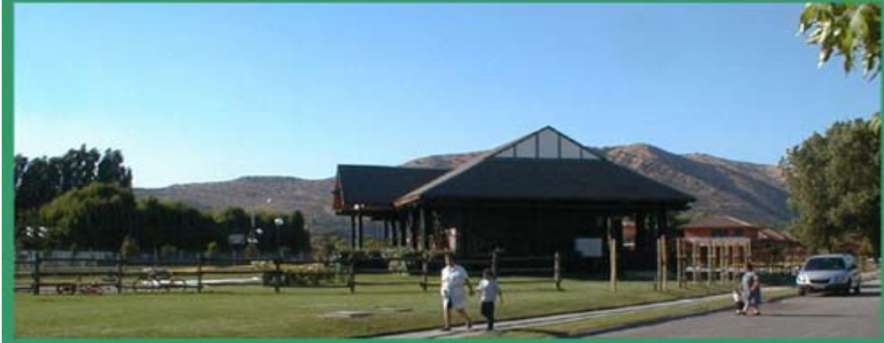
AVENIDA CACIQUE CHILENO "SANTA ROSA DE HUECHURABA"

La búsqueda de un entorno rural también forma parte del imaginario de los residentes, de estas nuevas urbanizaciones la que está respaldada y recreada a través de la publicidad que promueve estas viviendas aludiendo a la existencia previa del fundo cuyo nombre fue tomado por el conjunto residencial "El Carmen de Huechuraba" exacerbando las características bucólicas propias de este entorno. En este sentido, podemos ver un juego entre lo que ofrecen las empresas inmobiliarias (basadas en un detallado estudio de mercado que identifica esta necesidad por "el verde") y las expectativas de las personas que finalmente optan por trasladarse a este sector. De alguna manera podemos decir que hay una crítica que negativiza la imagen del actual vivir en la ciudad (ruido, contaminación, inseguridad, anonimato e individualismo) en oposición a una exaltación de esta vida supuestamente rural.