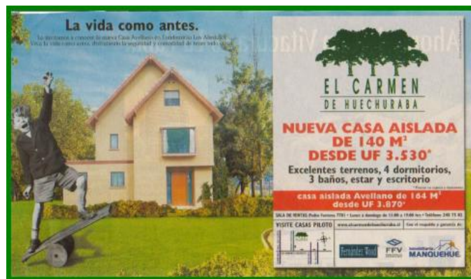
Publicidad “Vivienda y Decoración” Sábado 27 de Julio del 2002.

Lo interesante es que detrás del discurso publicitario y del de los sujetos existe una conceptualización de un “estilo de vida” que podríamos llamar barrial, entendiendo por este concepto (por barrial) una vida tranquila, segura y con áreas verdes, en la cual priman las relaciones de solidaridad entre vecinos, con lo que se está aludiendo al “barrio