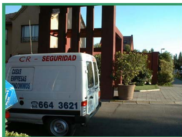
ENTRADA "SANTA ROSA DE HUECHURABA"

“Para nosotros vivir aquí ahora si es súper razonable porque los niños tienen un buen espacio tienen un aire relativamente digamos un poco más limpio no viven en pleno centro. Pueden salir a la calle sin peligro porque si quieren salir a andar en bicicleta yo no tengo ningún rollo, uno por las condiciones de seguridad y porque ellos lo pasan súper bien” (Ximena Rodríguez, 35 años)