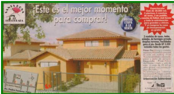
Publicidad “Vivienda y Decoración” Sábado 13 de Julio del 2002

etnográficas, en donde la apuesta es tomar todos aquellos elementos que den cuenta del contexto estudiado, es decir, más allá de considerar el espacio urbano como un territorio geográfico específico, se agrega un territorio que podríamos denominar como virtual (geografía virtual) que tiene consecuencias sobre las opciones habitacionales contemporáneas.