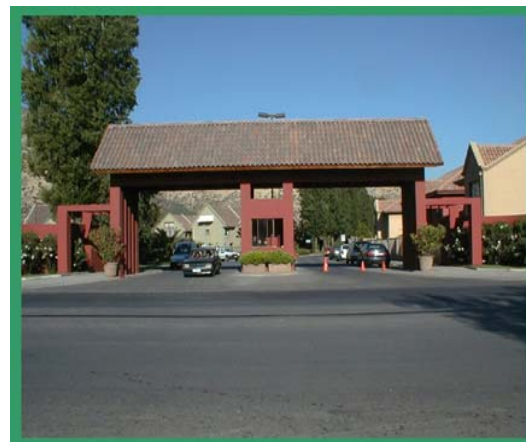
ENTRADA "SANTA ROSA DE HUECHURABA"

urbanización "Santa Rosa de Huechuraba". Estos dos lugares representan una manera específica de habitar el espacio, la cual está determinada en gran medida por la situación económica de sus habitantes. En este sentido el primer lugar mencionado responde a un sector social de un mayor poder adquisitivo en tanto que es un condominio, lo cual implica pagar por servicios que son tradicionalmente prestados por agentes estatales (municipio). El segundo lugar (Santa Rosa), si bien también es habitado por familias de clase media-alta, la relación con el sector privado es menor, manteniendo un mayor vínculo con los agentes estatales en relación a los servicios de mantención, los cuales son realizados por el Municipio.