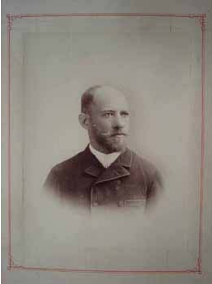
Álbum Julio Popper, Museo del Fin del Mundo, Ushuaia, Argentina

Posteriormente al texto se encuentran dos mapas, ellos van a otorgarle un valor científico al álbum además de situar al espectador en el recorrido geográfico, en lo que significa estar sumergido en una zona tan hostil y de difícil acceso.