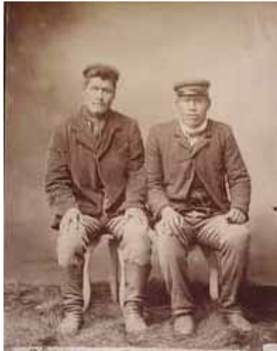
Los Shelknam. Indígena de la Tierra del Fuego. Sus tradiciones, costumbres y lengua. Homenaje a sus bienhechores. Buenos Aires, 1915. Museo Salesiano Maggiorino Borgatello, Punta Arenas, Chile.

Una tercera fotografía asociada a las anteriores nos muestra a dos hombres sentados, mirando de frente y vestidos a la manera europea. Nuevamente una fotografía de estudio, pero con hombres civilizados, aparentemente del todo, llevan pelos cortos y se encuentran bien vestidos.