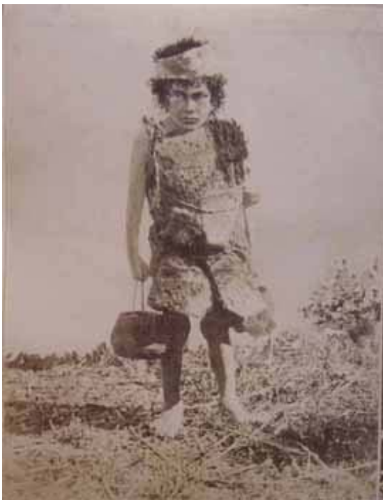
Museo Salesiano Maggiorino Borgatello, Punta Arenas. Álbum 1057, P:33

Para realizar un análisis de estas características es preciso ir hoja por hoja intentando descubrir que hay detrás de esta desesperada forma de editar, el o los motivos que existieron para activar una relación entre una fotografía y otra, los vínculos que se establecieron finalmente y nuestra propia interpretación de lo que vemos hoy como álbumes collage.