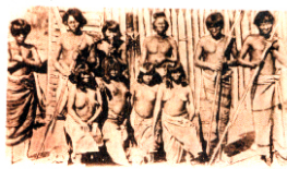
Banda yagán. El hombre se dedica a pescar con arpónes, peces y lobos marinos. Sus habitaciones tienen forma cónica y están temporales.

Sin embargo en esta imagen ¿qué factor podría haber influido para confundir a