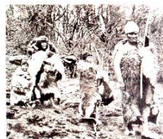
Los cazadores recolectores del sur del continente americano vivieron en condiciones materiales muy precarias.

Veamos algunos ejemplos relativos a las imágenes fotográficas de los ‘fueguinos’.