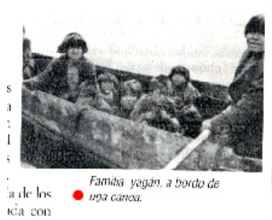
Familia yagán, a bordo de una canoa.

yaganes con los selk'nam, dentro de lo que podríamos denominar una identidad 'fueguina' que comparte cierto espacio geográfico ubicado en el extremo sur del continente americano, la situación se complica aún más si además se incluye una habitación tradicional mapuche y se le asigna el rol de ser una de las 'chozas con formas de colmena' de la cultura alacalufe o kawesqar.